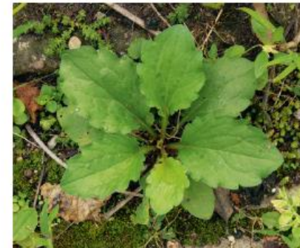
Jungpflanze bodennahe Rosette im ersten Jahr

ein-, zwei- oder bei Schnitt mehrjährige, bis 120 cm hohe krautige Pflanze, aufrechter, oben meist verzweigter, behaarter Stängel, bildet auf offenen Flächen dichte Bestände