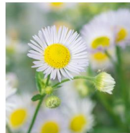
Blüte (Juni bis Oktober) viele Körbchenblüten, jede Blüte mit vielen sehr schmalen (0.5 mm), weissen bis lila Blütenblättern und gelben Staubblättern