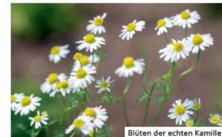
Blüten der echten Kamille

gebietsfremdes Kanadisches Berufkraut ( Erigeron canadensis ) oder heimisches Scharfes Berufkraut ( Erigeron acris ): beide haben jedoch kürzere Blütenblätter verschiedene Kamillen (Hundskamillen, Echte Kamille, Strandkamille): breite und weniger zahlreiche Blütenblätter sowie geteilte Blätter